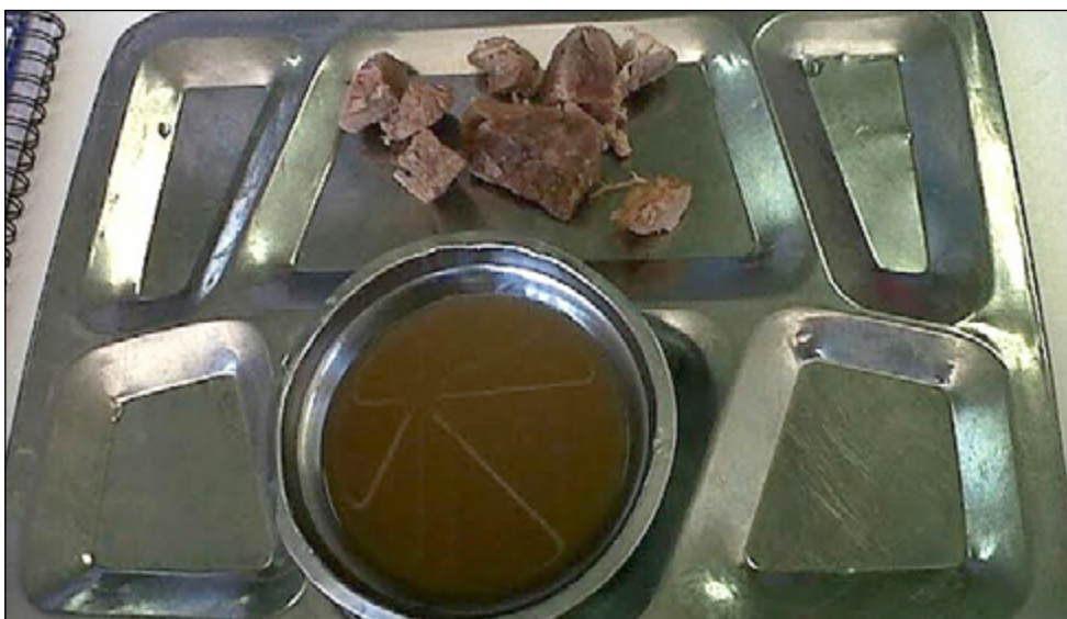
Bandeja de alimentación en comedor universitario ULA

indebidamente detenidos y narraron que recibieron golpes durante su detención. La situación del comedor universitario no se ha solucionado desde entonces ya que los procedimientos de compras centralizados impuestos por el Ejecutivo a las universidades autónomas, unido a los problemas generales de escasez y desabastecimiento de alimentos perjudican e impiden la adecuada adquisición de alimentos y demás insumos necesarios.