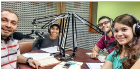
@dgomezgamba @HenrySrodriguez @DanielCastro88 @Mirlarodriguez_

https://www.youtube.com/watch?v=UNMGfhx_oEk https://www.youtube.com/playlist?list=PLv1-88UvnP87bwwg2vdeXVc1c4aQkeqll