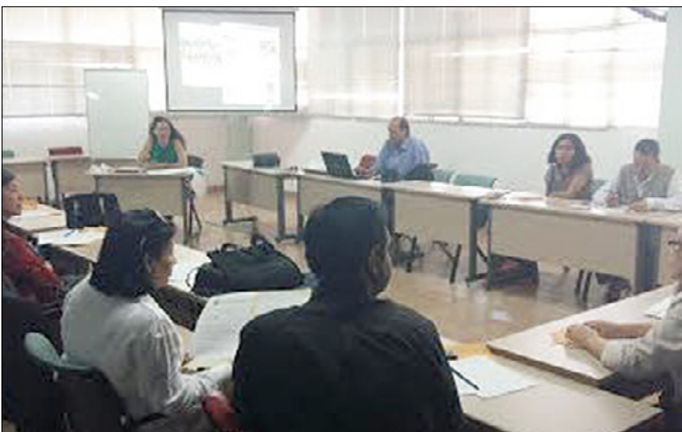
En Zulia y Mérida se debatió la realidad universitaria desde la óptica de los Derechos Humanos.