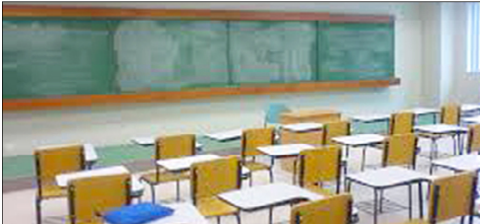
Esta situación genera menos días efectivos de clases.